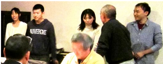
(本日の世話人；栃木がんセンターの皆さん、ご苦労さま!!)

最後になりましたが、ご出席の皆様、準備等でアドバイスを下さった支部会の皆様に改めて御礼申し上げます。