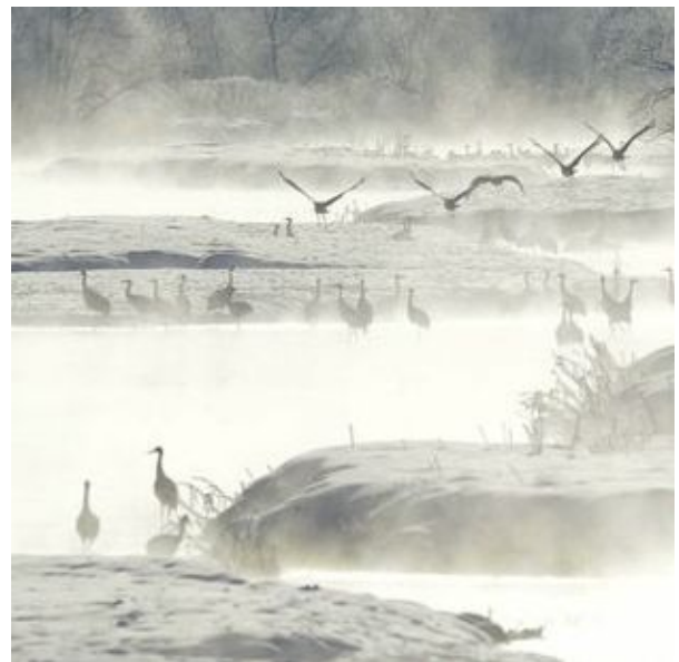
川霧の中で