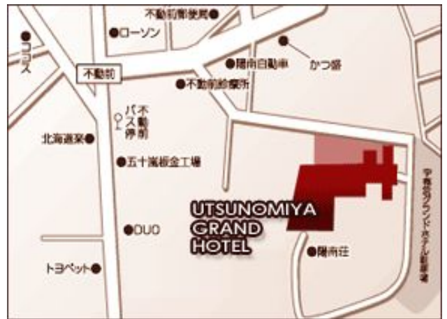
(講演会・懇親会会場 宇都宮グランドホテル)

尚、ホテルには駐車場が十分にありますが、託児所やベビーシッターの用意はしてありません。乳幼児を同伴される場合には、その旨をご了承下さい。